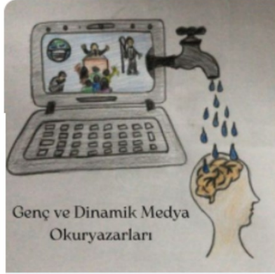
Genç ve Dinamik Medya Okuryazarları

Medya tarafından sunulan mesajların kişileri ve toplumları ne düzeyde etkilediği, mesajların alıcılar tarafından ne şekilde algılandığı, çözümlenme ya da eleştirel bir bakış açısıyla değerlendirilmeye tabi tutulup tutulmadığı önemli bir sorun olarak karşımıza çıkmaktadır. Medya okuryazarlığının esas amacı; farklı özelliklerdeki kitle iletişim araçları tarafından dağıtılan mesajların doğru algılanabilmesi, eleştirel bir bakış açısıyla değerlendirilebilmesi, gerçek ile kurgulu içeriğin ayırımının yapılabilmesi, kitle iletişim araçlarının sunduğu dünya ile gerçeğin aslında aynı olmayabileceğinin anlaşılması, medyanın yönlendirme ve yönetme fonksiyonlarının olduğunun farkına varılabilmesi gibi hedefler içermektedir.